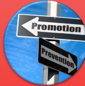
Digital Signate : Penataan media promosi dan informasi bagi pemerintah dan swasta yang tertat dengan baik.