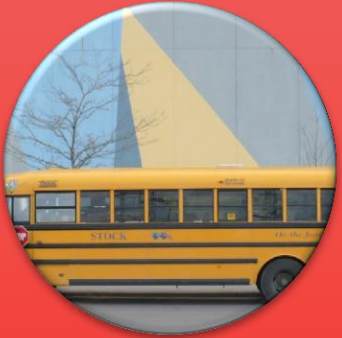
Intelligence Transportation System