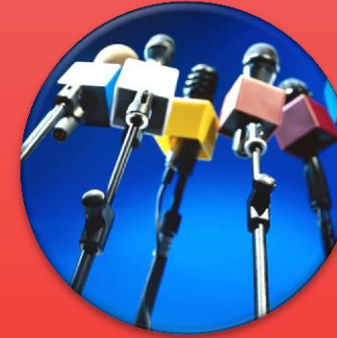
Digital Public Relation :