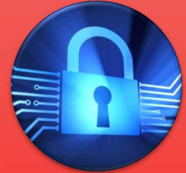
Peningkatan kualitas keamanan data/informasi