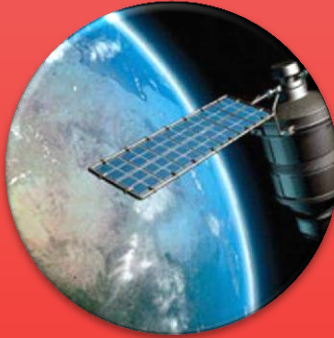
Device Tracking utk transportasi