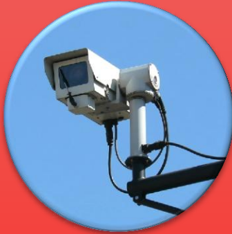
CCTV Surveillance, Smart Parking, Road Monitoring